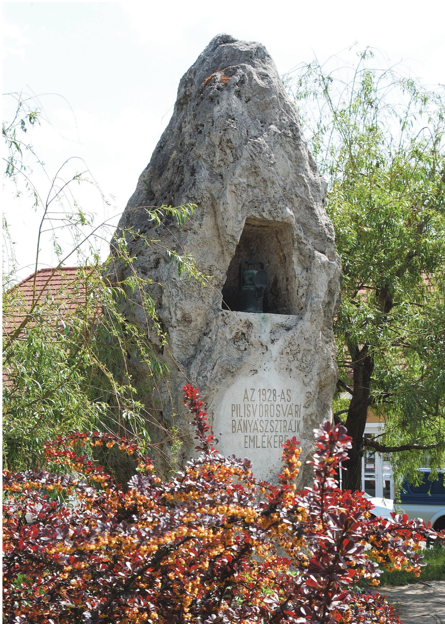
Az 1928-as bányászsztrájk emlékműve – 1978 (mészró) Pilisvörösvár