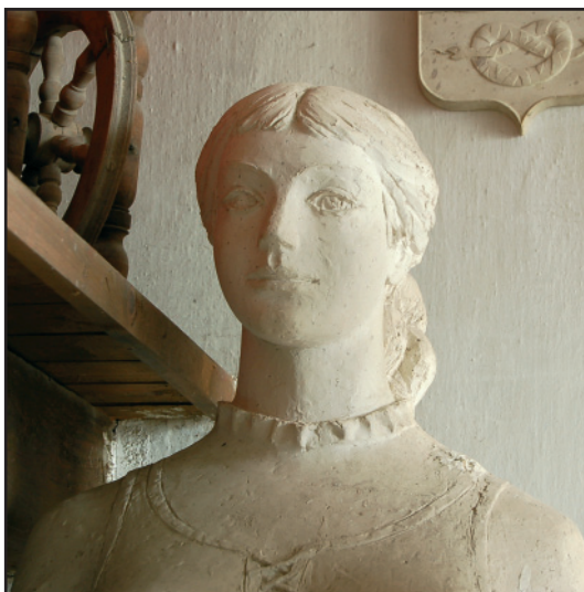
Fogadósobor Herceghalom – 1987 (a végleges mű anyaga mészkő)