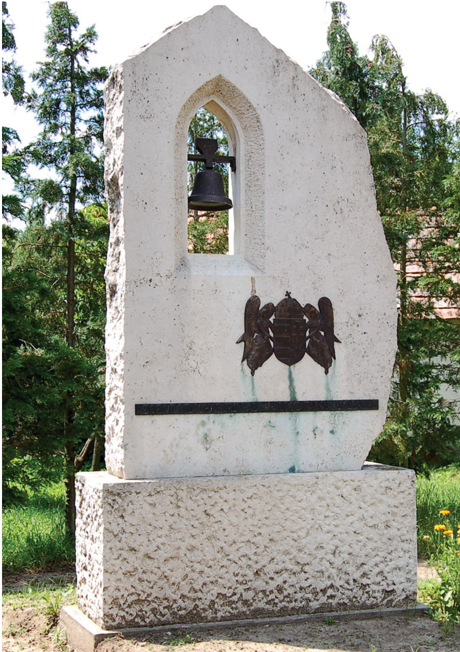
Hősi emlékmű – 1995 (mészkö) Pálfa