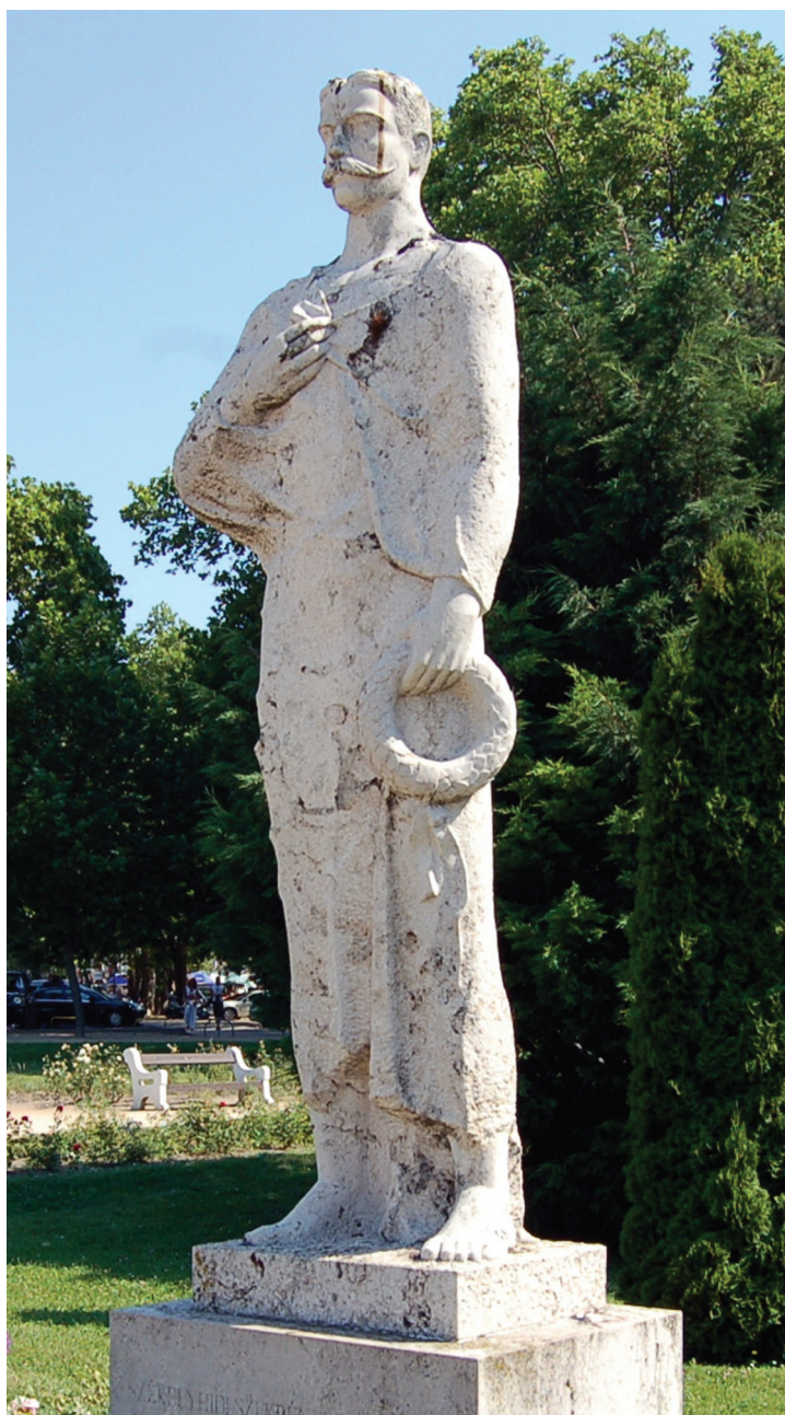
Székelyhidi Szekrényessy Kálmán szobra – 1997 (mészki) Siófok, Balaton-part