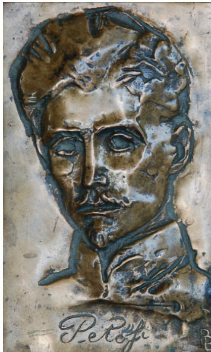
Petőfi Sándor – 1973 (bronz)