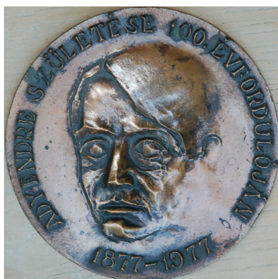
Ady Endre – 1977 (bronz)