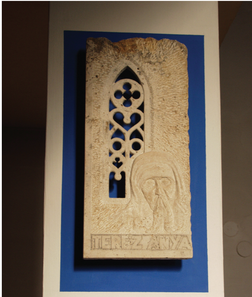
Teréz anya – 1997 (mészki) Pilisvörösvár, Szent Család templom