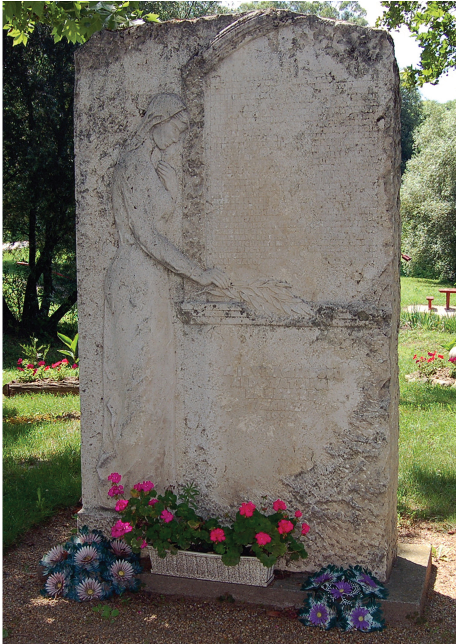
Hósi emlékmű – 1993 (mészáló) Szárzsd