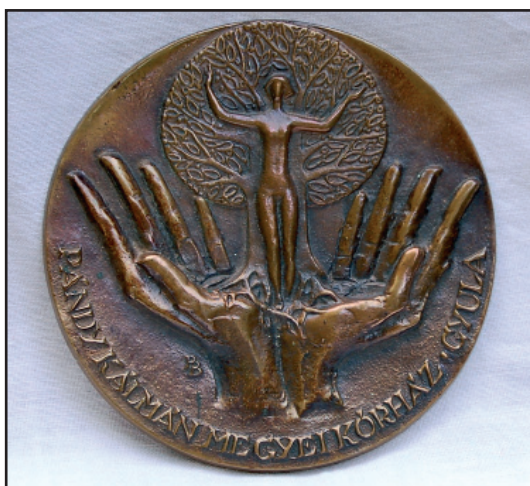
Plakett a gyulai kórház felkérésére, 1988-ból