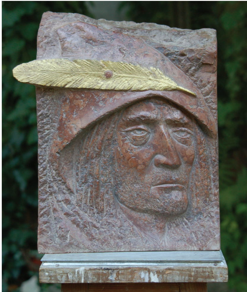
Villon – 1999 (vörösmárvány)