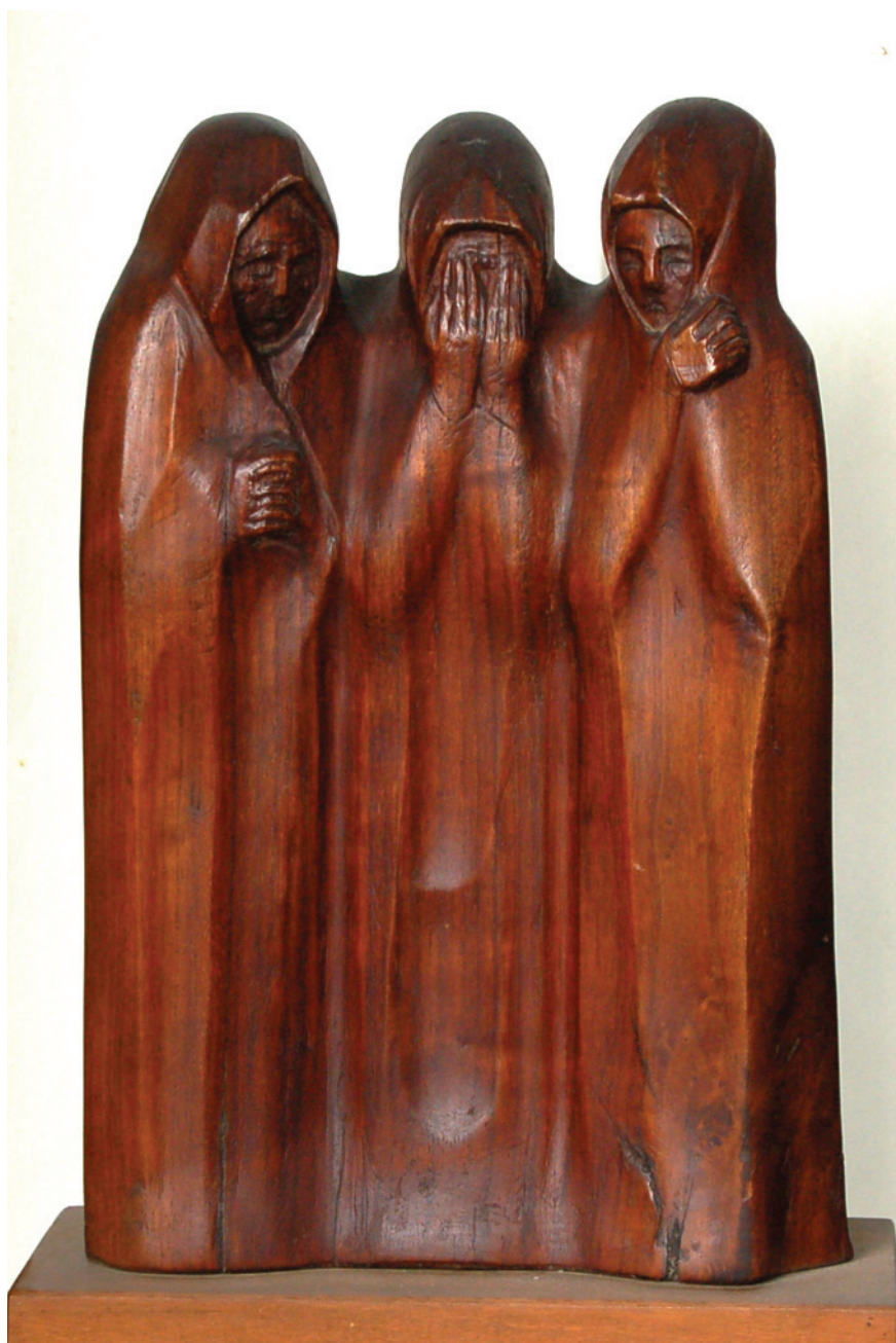
Siratók – 1975 (fa)