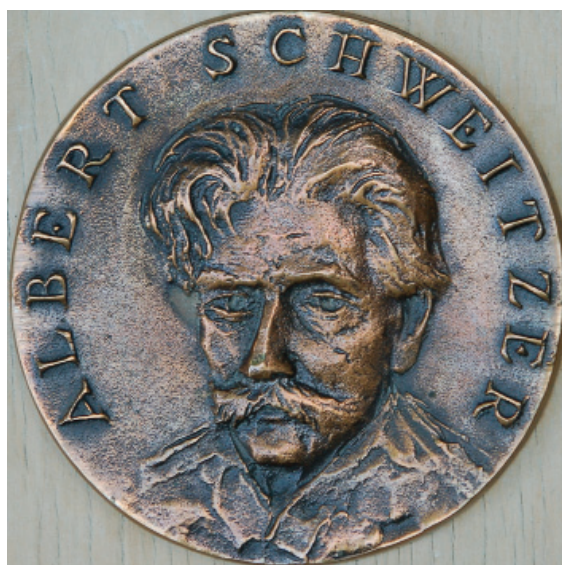
Albert Schweitzer – 1992 (bronz)