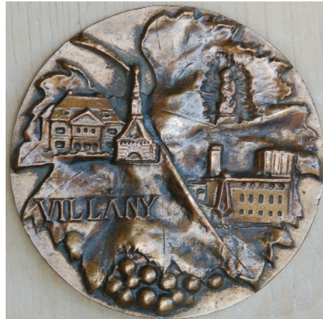
Állami Gazdaságunkért, Bácsszőlős – 1983 (bronz) Állami Gazdaságunkért, Villány – 1980 (bronz)