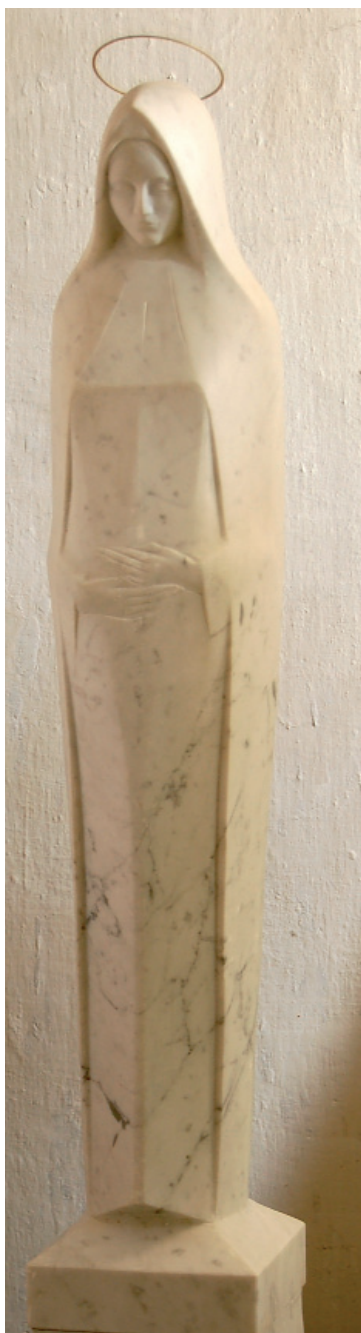
Áldott állapotban – 2006 (márvány)