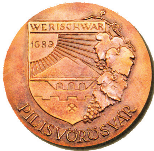
Bajnok Béla bronzplakettje Pilisvörösvár betelepülésének 300. évfordulójára