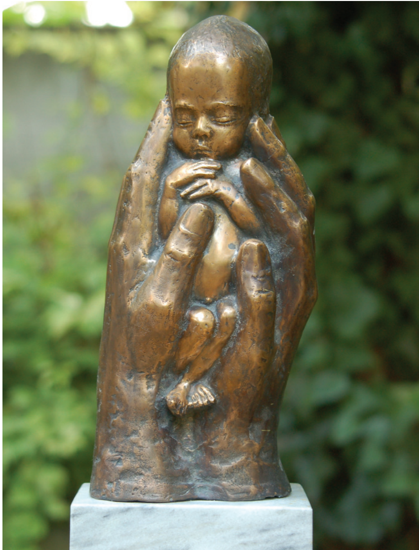
Hurrá! (Lilike) – 2008 (bronz)