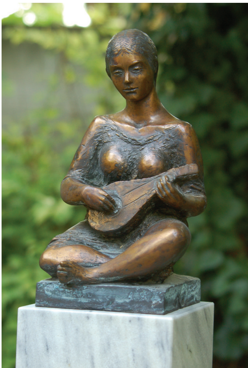
Leányka mandolinnal – 2005 (bronz)