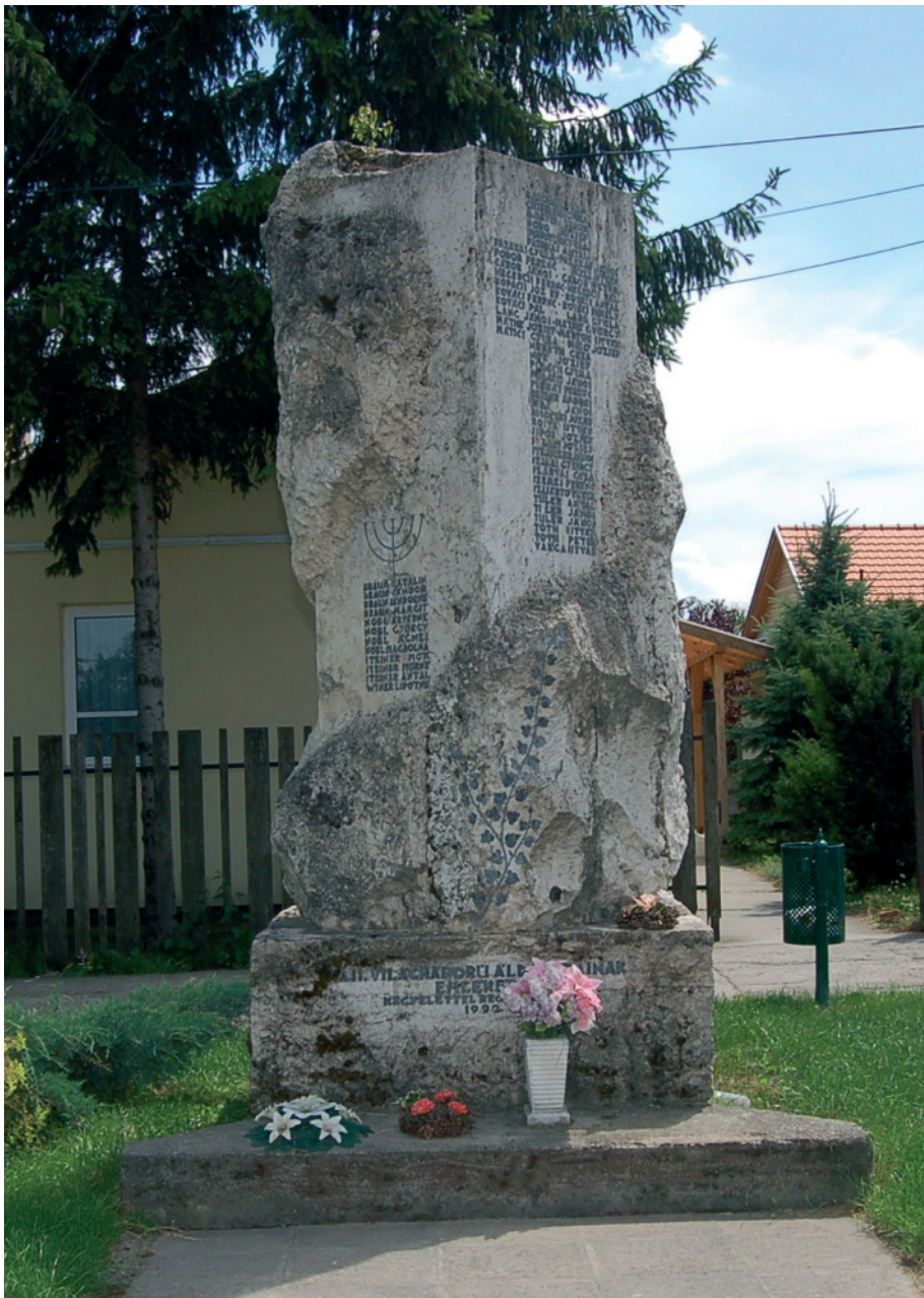
Hősi emlékmű – 1992 (mészakő, ólombetűk) Regöly