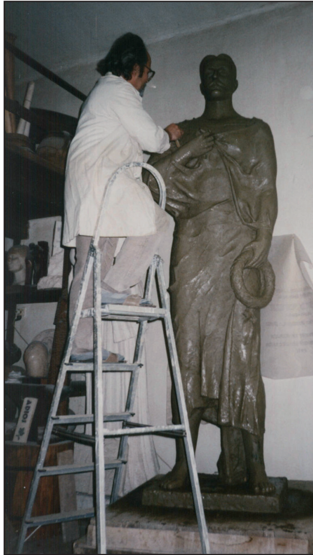
A Szekrényessy-szobor agyagmintázása

II. János Pál pápa szentelte fel a római Szent Péter Bazilika altemplomának magyar kapuját 1980. október 8-án, amelyet magyar művészek alkotásaival díszítettek. Há-