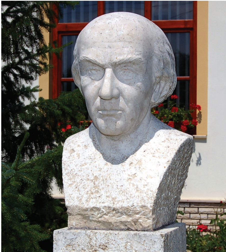
Illyés Gyula mellszobra – 2002 (mészki) Pálfa, Községháza