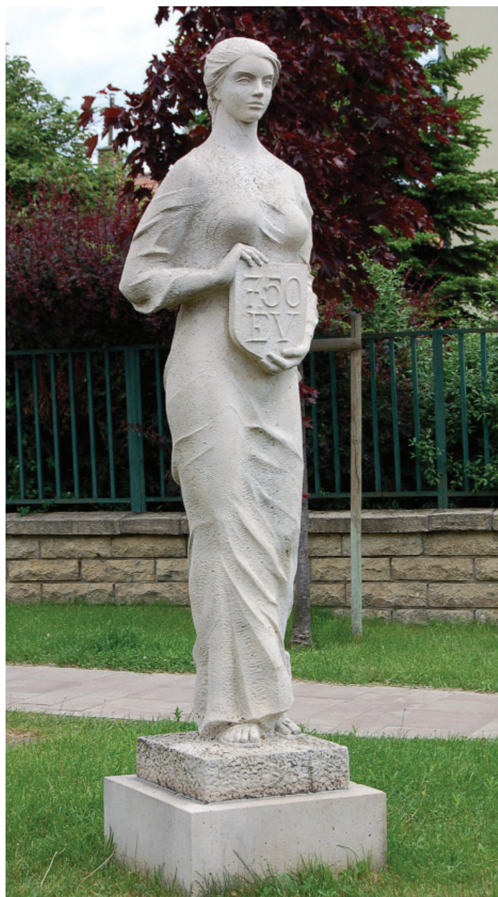
Városköszöntő – 1988 (mészki) Budaörs, Városháza