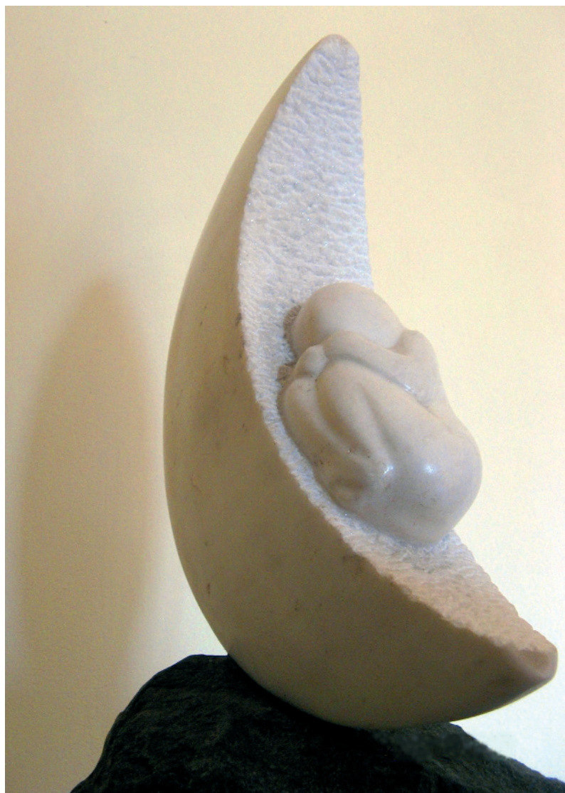
Holdanya – 2004 (márvány)