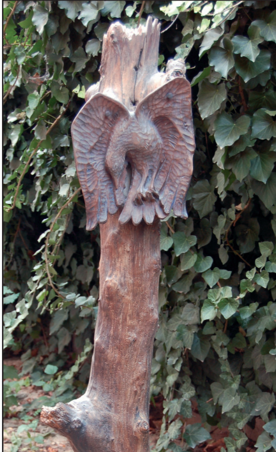
Természetvédelem – 1977 (fa)

Egyik egy kicsiny plakett, mellyel szülővá- rosodat, Gyulát tisztel- ted meg, annak is sok- sok életet világra segí- tő, meggyógyító híres- neves kórházát. Dús- lombú fa ad glóriát egy életét, egészséges ön- magát diadalittasan fel- mutató karcsú nőalak körül. Szépségén, töké- letességén örködik a gyógyítást jelképező két kéz.