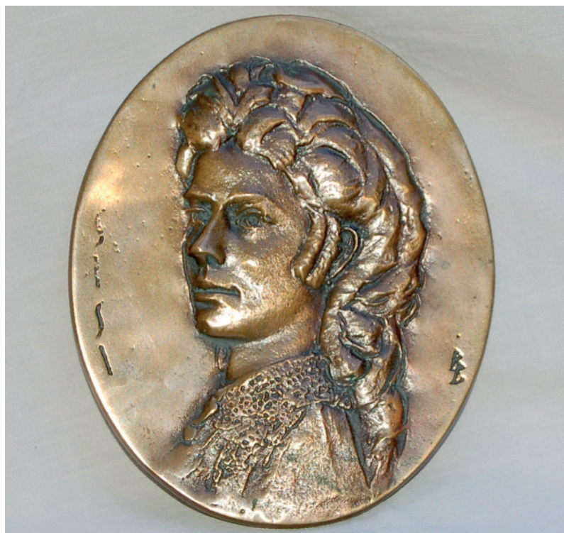
Sissi – 1999 (bronz)