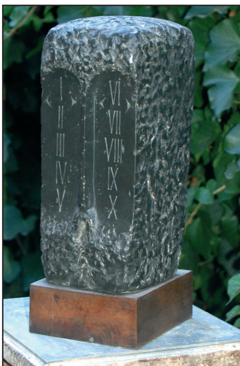
Mózes – 1969 (fekete márvány)

Sokat gondolkodom azon, hogy egy mű megalkotása előtt milyen gondolati, lelki magasságokat-mélységeket jár meg a művész? Hogy képes mindezt egy kőtömbbe, festővászonra vagy kottapapírra tömöríteni úgy, hogy ő maga is elégedett legyen vele, és művének befogadója is azt érezze ki belőle, amit „kell”, vagyis azt, ami a mű hivatása?