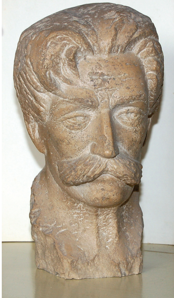
Albert Schweitzer – 1996