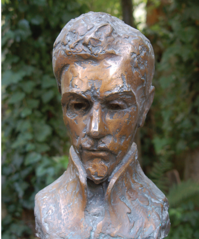
Petőfi mellszobra – 1973 (bronz)