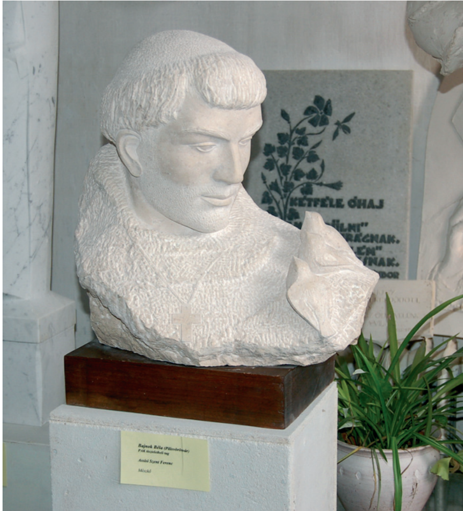
Assisi Szent Ferenc – 2007 (mésző)