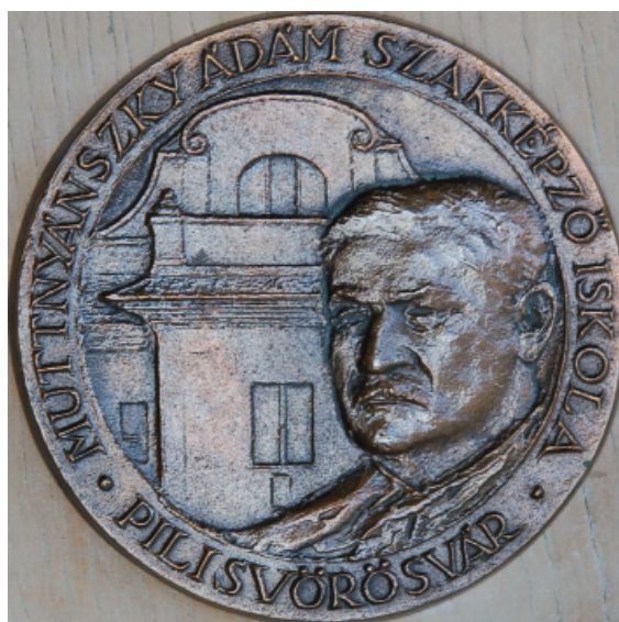
Muttnyánszky Ádám Szakképző Iskola – 2003 (bronz)