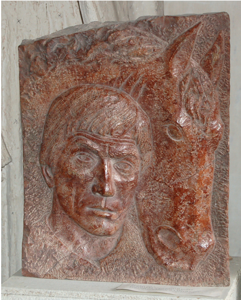
Nagy László domborműve – 1999 (vörösmárvány)