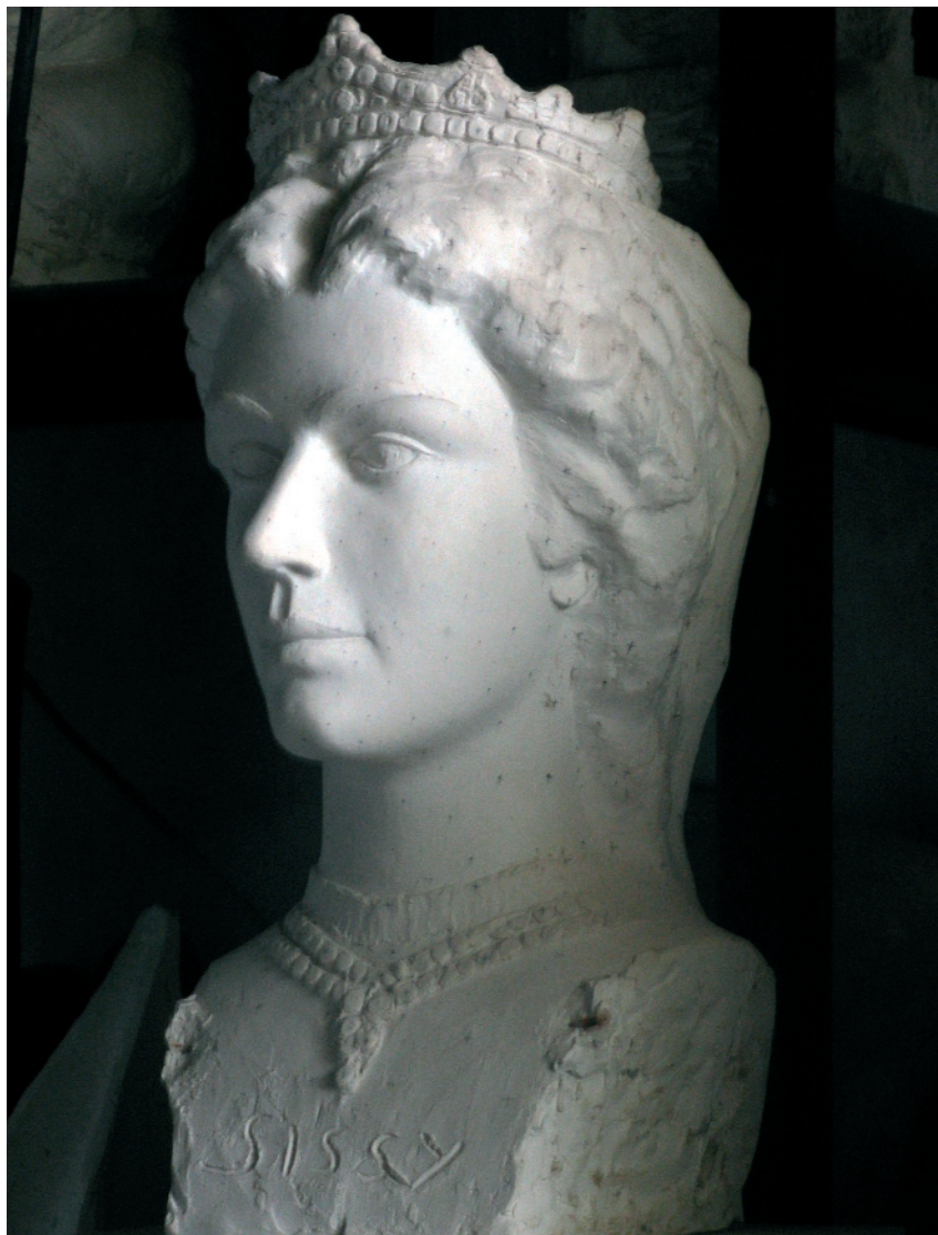
Sissi-terv. A mű 1998-ban készült el (bolgár mészke)