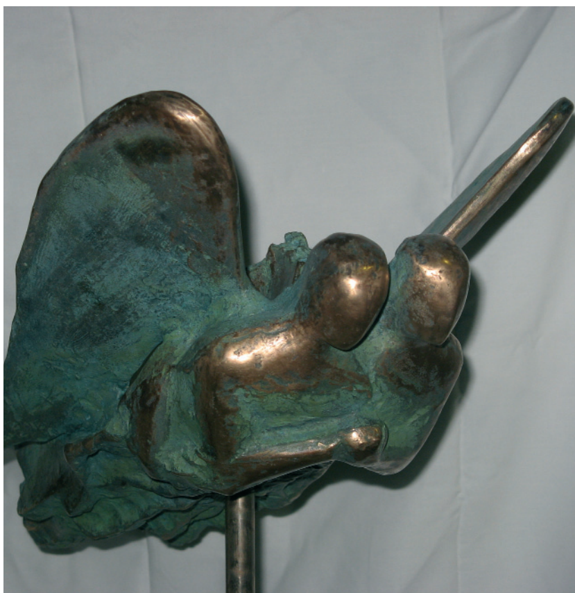
Szárny szegett angyalok repülése – 2007 (bronz)