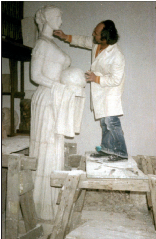
A herceghalmi Fogadószobor gipszmintázása

Tervezett és készített címereket, emlékplaketteket, emléktáblákat, polgármesteri nyakláncot.