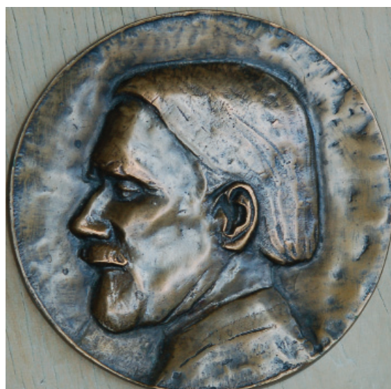
Kodály Zoltán – 1971 (bronz)