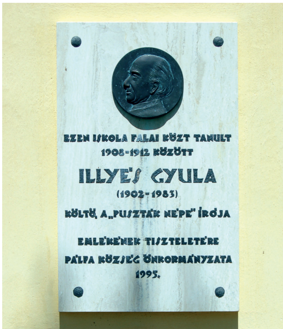
Az Illyés Gyula-emléktábla domborműve – 1995 (bronz) Felsőrácegrespuszta